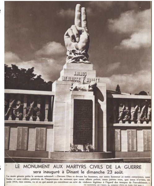
LE MONUMENT AUX MARTYRS CIVILS DE LA GUERRE sera inauguré à Dinant le dimanche 23 août.