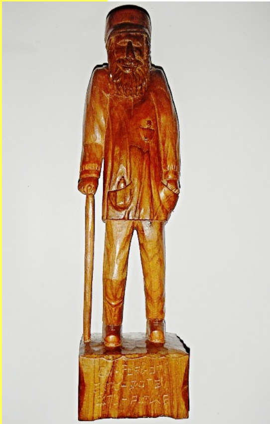
Le « Forbotî » par Paul MOSTY