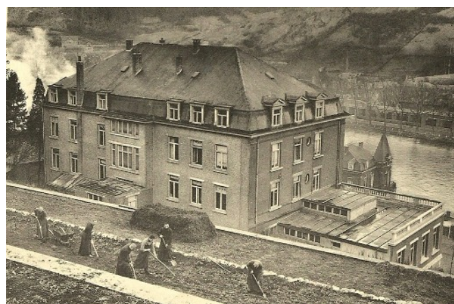
Derrière l'Institut Hydro-thérapique