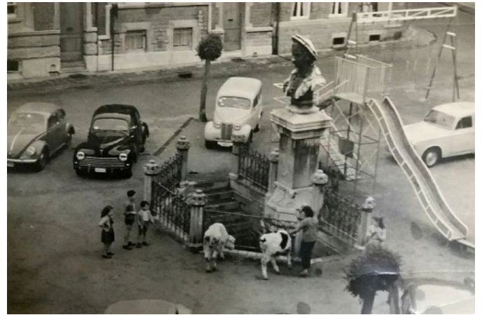
A la statue de Patenier, une pyramide humaine, passe encore, mais des bovins!