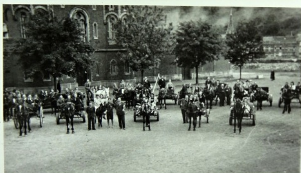
1942 - Souvenir de la Fancy-Fair de Dinant au profit des prisonniers