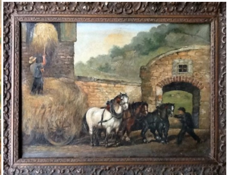
Oeuvre de J. Stoffels (20ème siècle): "Dinant, paarden met boer" (le fermier avec ses chevaux).