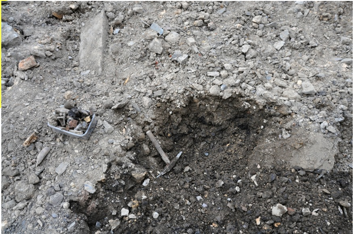
3. Les premiers artefacts apparaissent, notamment deux fragments de chenets en terre cuite et un de creuset. Les résidus jaunâtres qu'on retrouve çà et là sont constitutifs d'un mortier à la chaux.