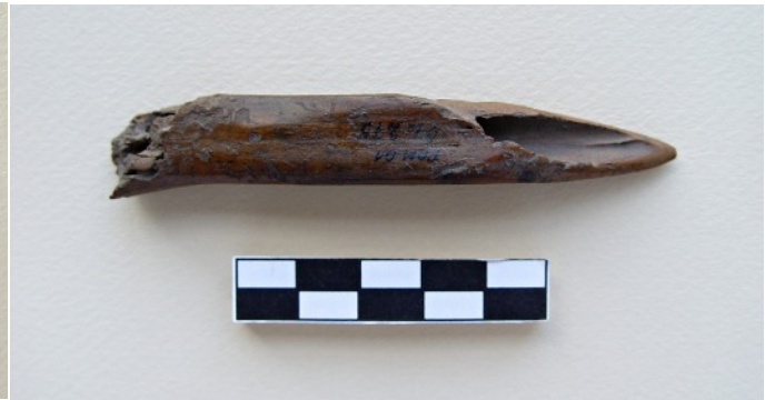
Deux des poinçons en os retrouvés à Pommeroeul.