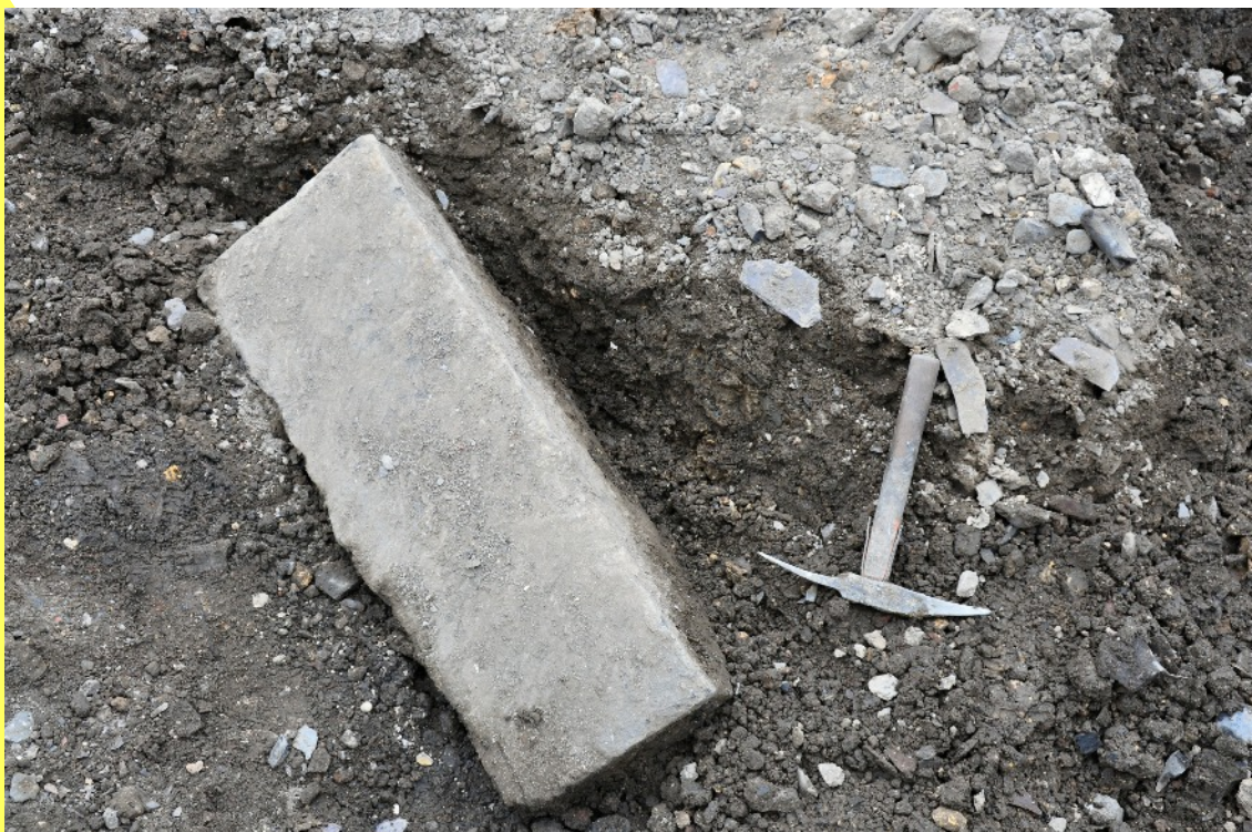
4. Notre pierre est vraisemblablement une marche d'escalier. Sa largeur du bas est quelque peu inférieure à celle du haut. Elle était sans doute insérée dans une volée légèrement courbe. Sa face de contremarche est bien plane. En bordure de photo, tout au dessus à droite, un des os dont nous reparlerons.