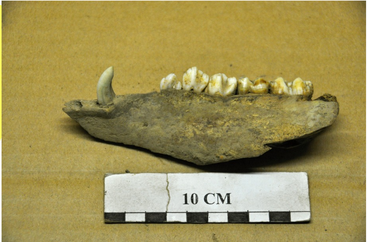
15. D'un (gros) chien : mandibule de la mâchoire inférieure ou supérieure ? Voir la canine recourbée et son usure.