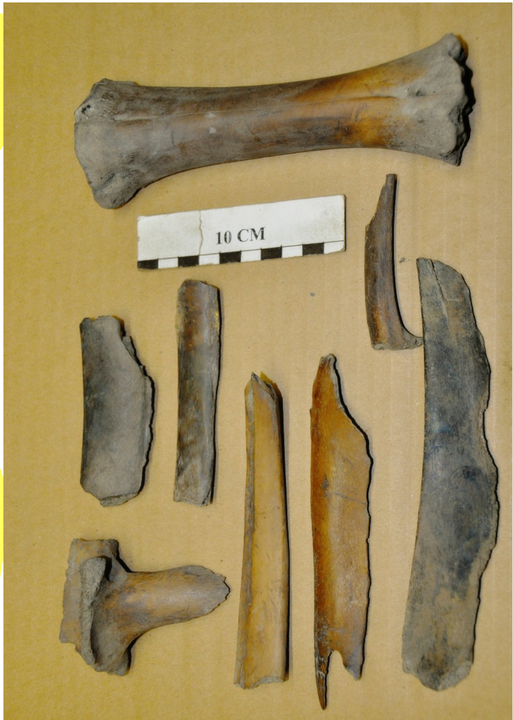
22. Côtes d'animaux ayant vraisemblablement servi d'outils (raclours?). Lisses, elles portent néanmoins de très nombreuses égratignures. Celle de droite aurait même pu servir de couteau. Le gros os semble avoir été utilisé comme pilon.