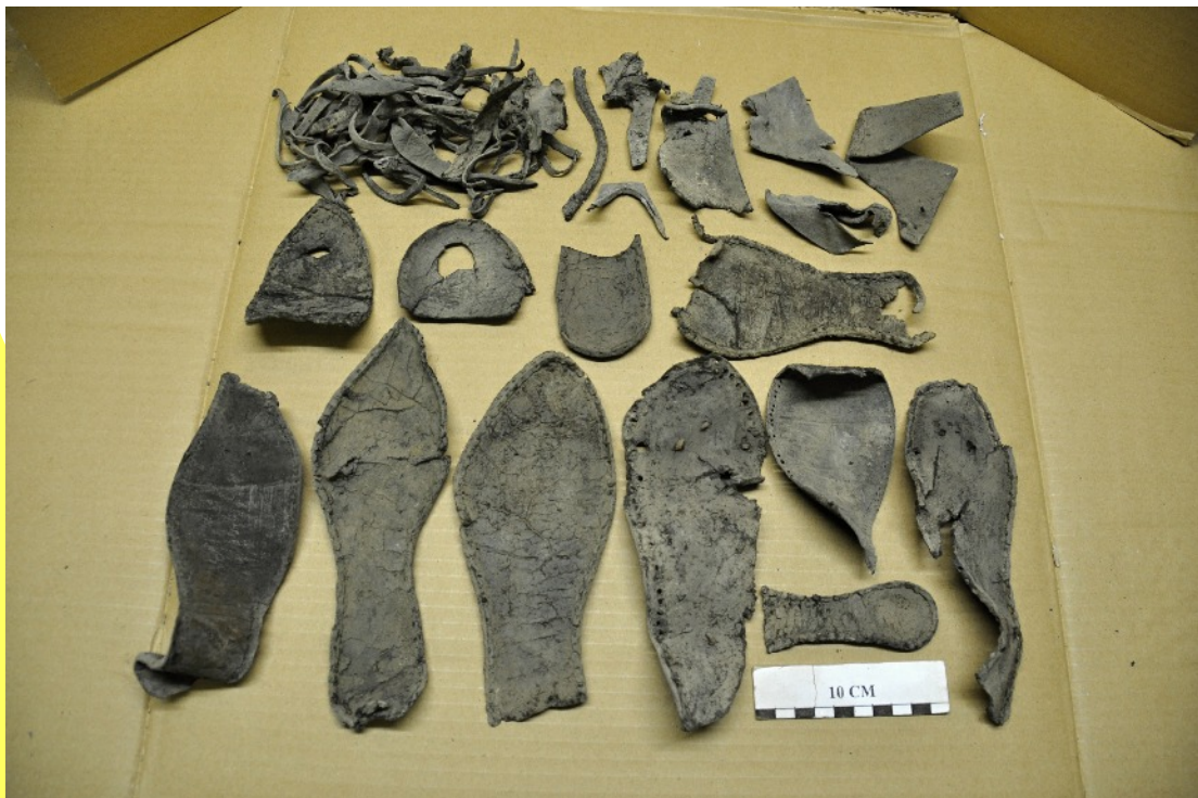
19. Semelles en cuirs et déchets de façon. La semelle « pointue » est celle d'une « chaussure à la poulaine » très fréquente au 15 ème siècle. A remarquer la petite semelle pour enfant (au-dessus de l'échelle graduée). Des morceaux de cuir sont visiblement de récupération. L'activité de cordonnier est celle qui s'adonne au travail du cuir neuf, celle du savetier au cuir usagé. Mais cette différence est toute relative.