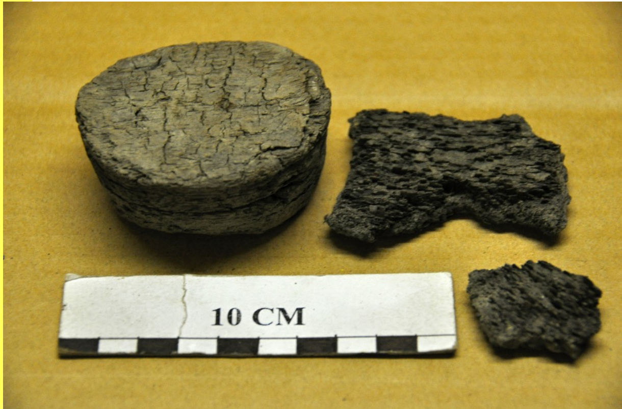
17. Gros bouchon en bois et deux fragments d'un tonneau. La courbe de ces derniers permet d'envisager un diamètre de plus d'1m20 pour le tonneau.