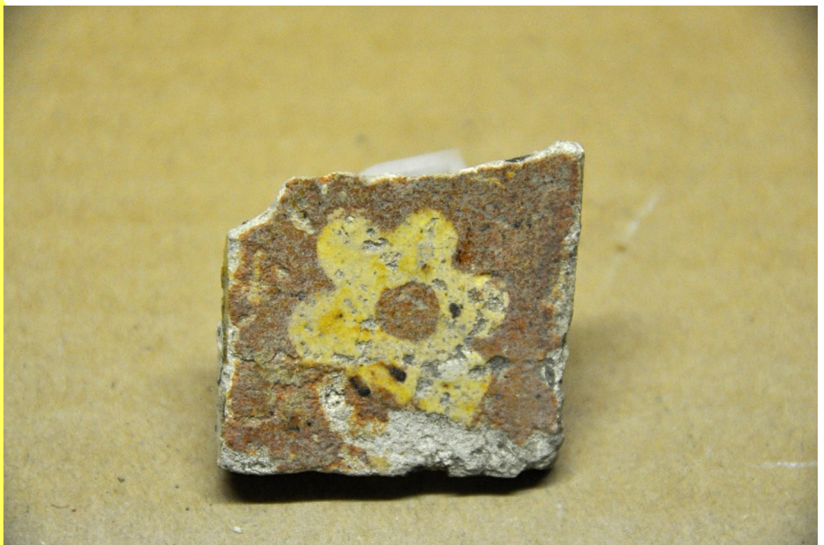
23. En haut, trois fragments d'un épais pavage de foyer (présence de parties brûlées). En bas, moyen et petit carrelages. Voir la fleur dessinée sur l'un d'eux.