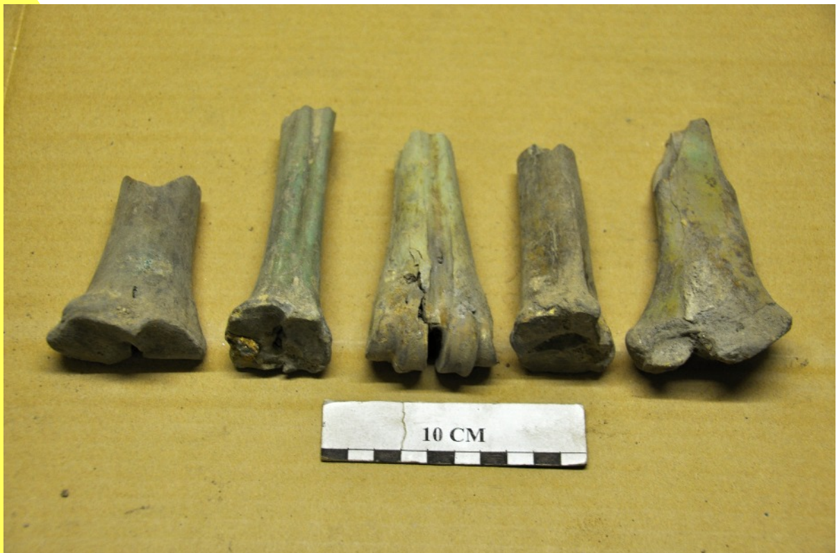
16. Dans les déblais, rappelons-le, assez homogènes quant à la période à laquelle ils se rapportent (Moyen-Age) et à leur endroit de provenance initiale (sans doute une seule maison d'habitation), nous avons trouvé ces cinq os similaires, leur longueur variant de 9 cm à 14 cm. Chacun présente une cassure très nette faite de la main de l'homme. Aurait-on voulu, dans une phase ultérieure, les aménager, en les effilant, afin de s'en servir comme poinçons pour percer le cuir ? On ne peut s'empêcher de les rapprocher de ceux découverts sur le site gallo-romain de Pommeroeul, quant à leur aspect et même à leurs dimensions. « Il s'agit d'un fragment d'os long dont l'une des extrémités est pointue et taillée en biseau ; ce type d'outil est utilisé dans le travail du cuir » (Espace gallo-romain d'Ath). Voir les clichés qui suivent.