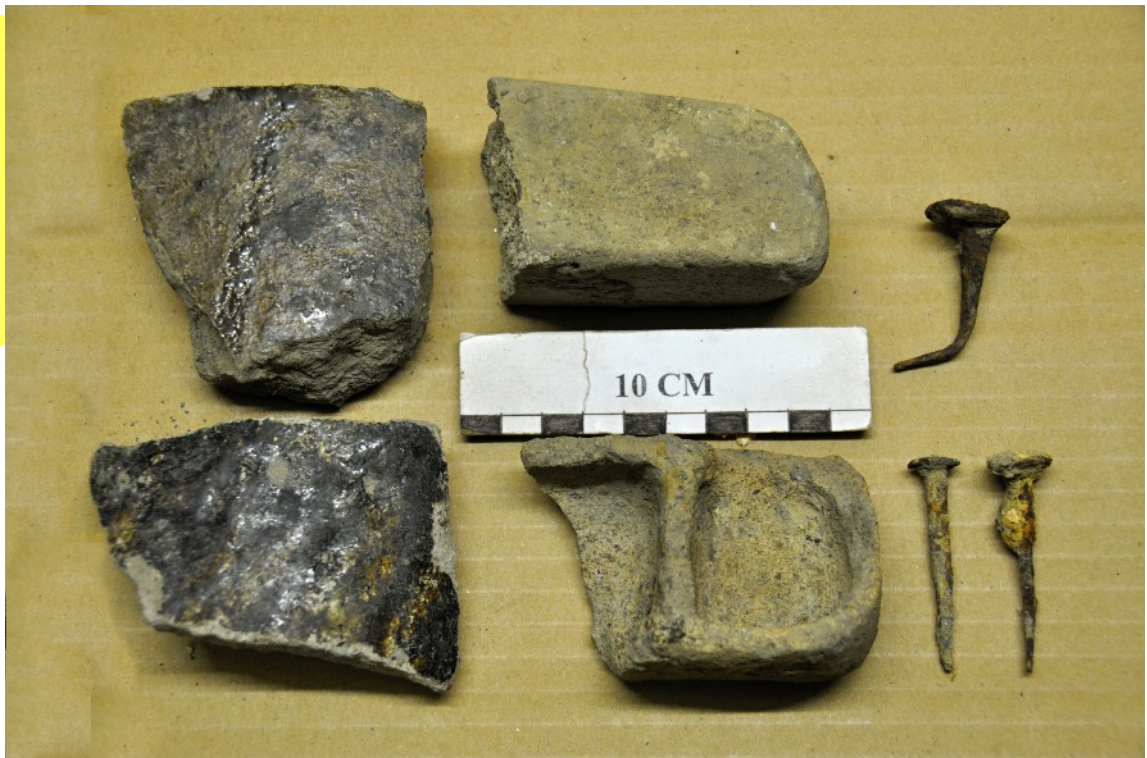
11. Deux fragments apparemment du même chenet et deux fragments du même creuset. Ceux-ci sont fortement vitrifiés, attestant de ce que le creuset a été souvent réemployé.