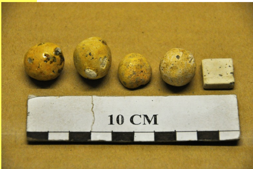
18. Billes en terre cuite glaçurées jaune et un pion de jeu en os. Elles sont grossièrement sphériques et comportent de petites protubérances apparues à la cuisson. Ce n'est qu'à partir de la Renaissance qu'elles deviendront des sphères parfaites. Ci-après, photos de billes similaires du 14 ème siècle (Les Amis du Vieux Château de Brie-Comte-Robert (une bille), Saint-Martin-du-Mont (deux billes)).