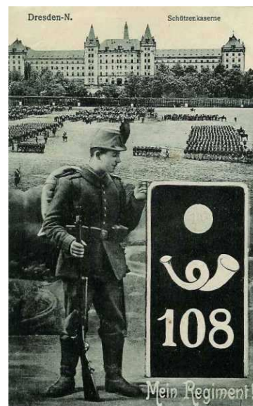
Régiment qui dévasta Dinant le 23 août 1914.